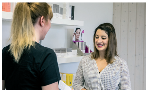
Produkte, Verkauf und Beratung