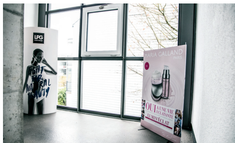
Der Weg ins Studio