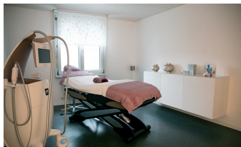
Endermologie® und IPL Behandlungen