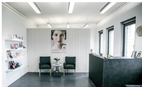
Anmeldung und Warteraum