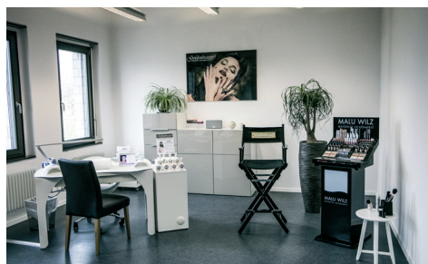
Nail und Make-Up