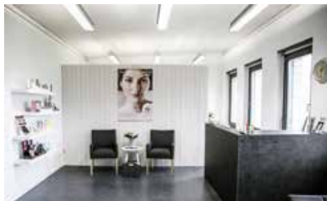
Anmeldung und Warteraum