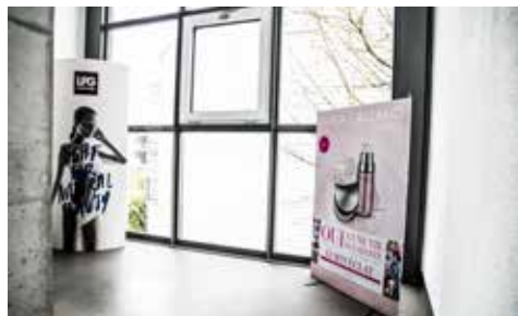
Der Weg ins Studio