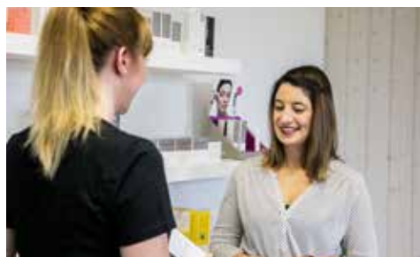
Produkte, Verkauf und Beratung