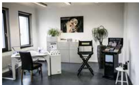
Nail und Make-Up